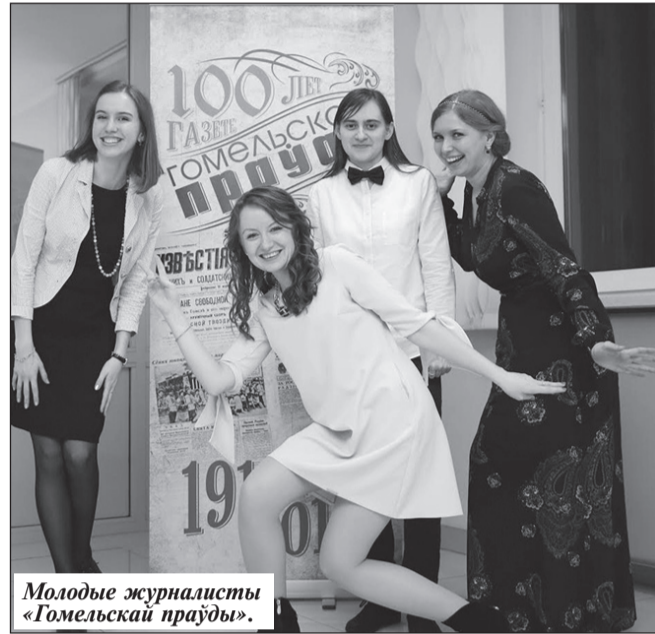
Молодые журналисты «Гомельской праўды».