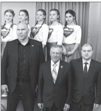
Валуев открыл фестиваль ГТО.

27 марта на базе унечской школы № 3 состоялся фестиваль Всероссийского физкультурно-спортивного комплекса «Готов к труду и обороне».